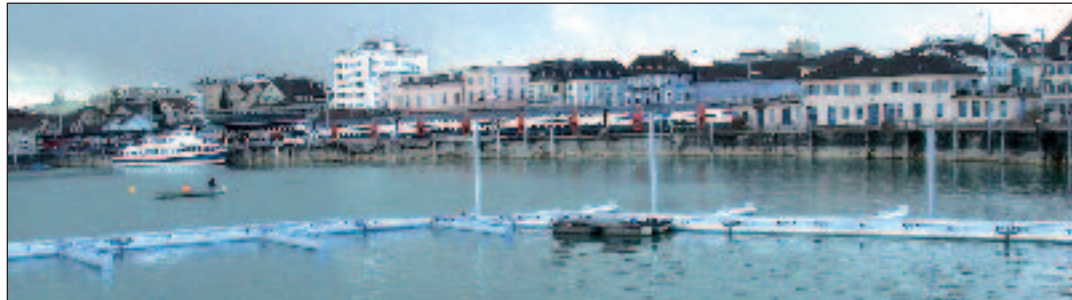
Der Romanshorner Wassersporthafen der SBS AG ist um 70 neue Plätze auf insgesamt 128 Liegeplätze erweitert worden.

Der gegenüber den Anlegestellen der Weißen Flotte liegende Romanshorner SBS-Hafen erstrahlt jetzt im neuen Glanz. Gleich nach dem Baubeginn am 5. Januar 2009 wurden die vormontierten Schwimmelemente für die Bootsstege ins Wasser gesetzt und zusammenschraubt. Pünktlich zum Saisonauftakt, Anfang April, wurden die ersten Schiffe an ihrem neuen Platz festgemacht. Die Kapazität des SBS-Hafens wird um 70 auf insgesamt 128 Liegeplätze erweitert. Insgesamt bedeutet das jetzt eine Fläche von 17.940